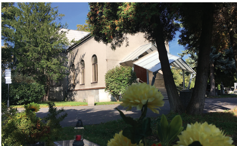
Stávající smuteční síň bude už za chvíli minulostí.