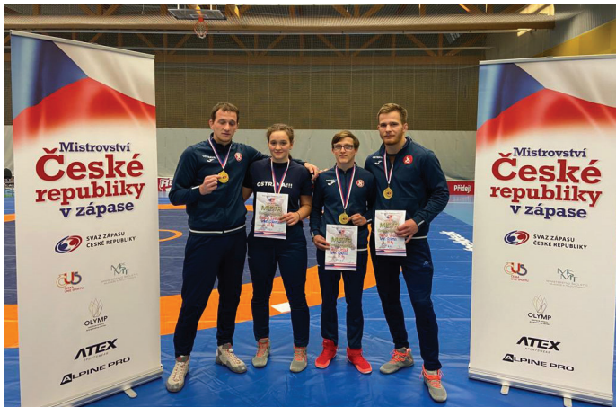
Vítkovičtí mistři republiky

V sobotu 16. října se v Praze po roční pauze zaviněné covidovou pandemií konalo Mistrovství ČR v zápase ve volném stylu mužů a žen 2021. Směřovala sem i skupina osmi vítkovických volnostylařů s medailovými ambicemi. Nezklamali a z Prahy přivezli čtyři tituly!