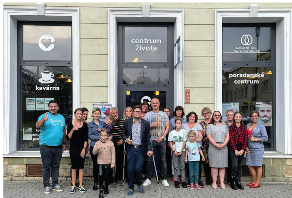
Text a foto: Nadační fond Pavla Novotného

Ušli jsme dlouhou cestu a pomohli lidem, kteří nás potřebovali! Doufáme, že se nám podaří kráčet dál.