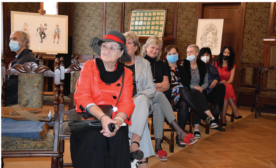
Vernisáž se konala 11. října.